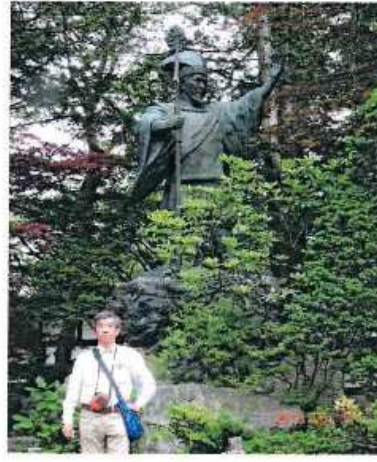
昭和49年建立 北海道神宮