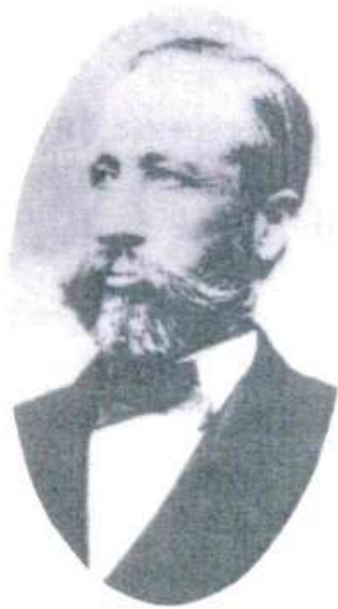
(株) 教文館 1993年発行 より引用

当時五十三歳のクラークは水田流にいえばすでにold manでありながら、札幌の八月月はまさに朝氣満々、永遠の青年の如くに理想を抱いて活躍してゐたのであるから、此の老人のようにには二重の重い意味がある。