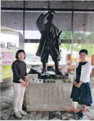
昭和46年建立 札幌市役所ロビー