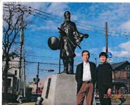
平成30年建立 佐賀城公園